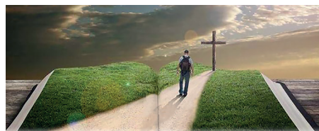
Віра в Бога не данина традиції чи культурі. Віра в Бога це щоденне життя згідно з Євангелієм Ісуса Христа.