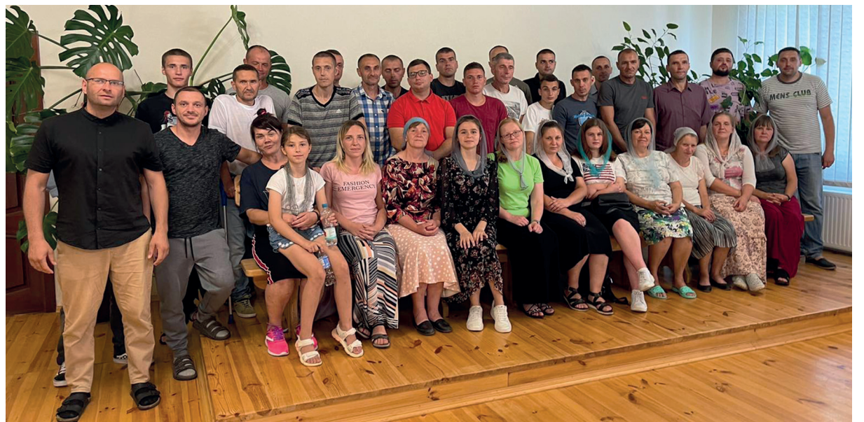
Зустріч з колишніми реабілітантами, які звільнилися від наркотичної і алкогольної залежності в християнському центрі реабілітації (м. Рівне) упродовж 2020-2021 рр.